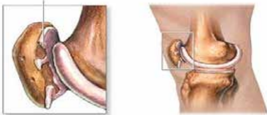
Condromalacia de la rótula, o rodilla del corredor

Es la destrucción del cartílago articular de la rotula que se encuentra en contacto con los condilos femorales y la escotadura intercondílea , Suele producir dolor en la cara posterior de la rotula y es muy frecuente en jóvenes deportistas.